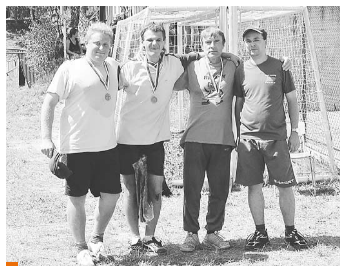
Radost a únava, vítězný tým turnaje Šachisti z Týnce (s medaillemi) s předsedou TJ Sokol Ostředeck