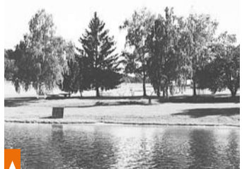
Pláž na Nové Živošti je travnatá a vstup do vody pozvolný

Na co by si měli dát návštěvníci pozor, čeho se vyvarovat?