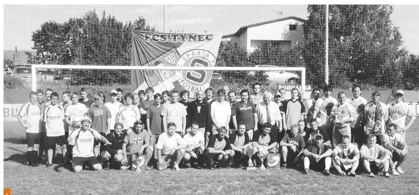
Aktéři fotbalového turnaje v Bukovanech

Čtvrtfinálovými zápasy, které jsou rozhodující pro úspěch či neúspěch na turnaji, prošel suverénně Modrý Balet. Penaltový rozstřel rozhodl o postupu FCS Formanka Benešov. Jediný gól rozhodl, že vítěz prvního ročníku a obhájce tým Bukovan nepřešel přes Real Benešov. Prořadatelé turnaje, FCS Týnec, skončila cesta ve čtvrtfinále, kde byli nad naše síly kamarádi z Fanclubu Děčín. Přestože