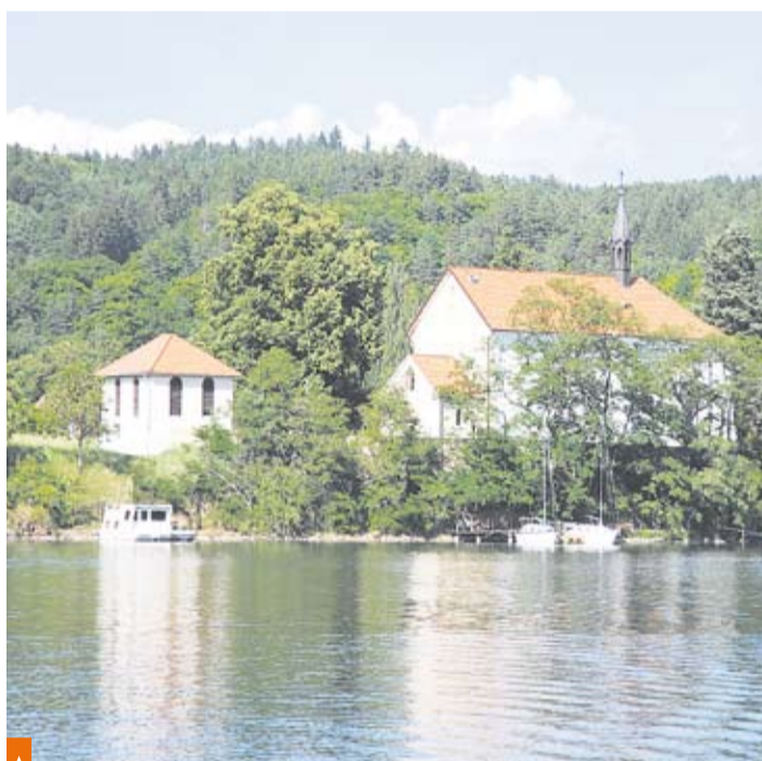
Při plavbě parníkem uvidíte na skalnatém výběžku stojící živohošťský kostel