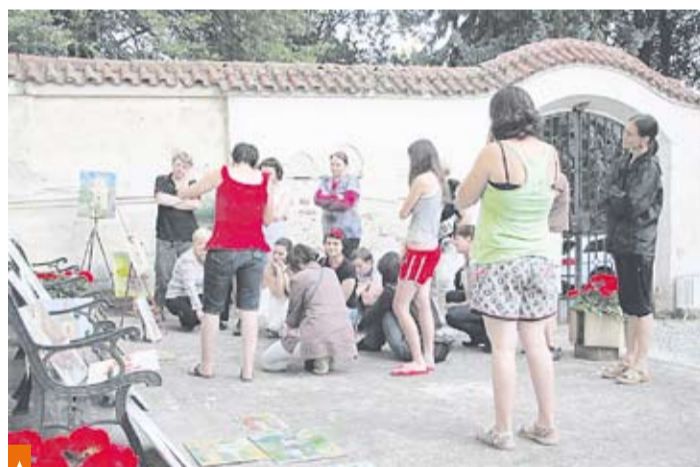
Večerní konzultace k obrazům

Smutek z posledního dne společně zažene shon při instalaci výstavy obrazů, které jsme za ten týden na Sázavě namalovali. Vstupní hala s krásnými freskami je k tomu jako stvořená a slavnostní vernisáž je pro nás chutnou třešinkou na našem týdenním „dortu malování a vidění“.