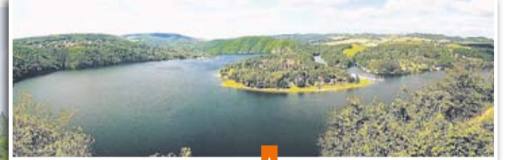
Slapská přehrada je krásné rekreační místo kousek od Prahy

pocházejících z trestné činnosti, nebo kterými byla trestná činnost spáchána a dále pak na aktivní pá- trání po utonulých nebo pohřešo- vaných osobách.