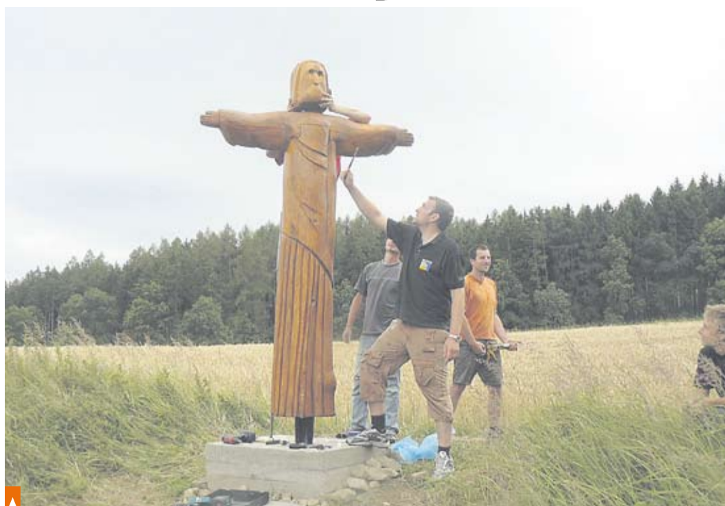
Instalace dřevěné sochy Krista na kopci Buková u Neveklova

Proběhlo celkem 9 akcí určených pro veřejnost, kterých se zúčastnilo asi 330 lidí a 3 čistě pracovní akce určené jen pro členy. Nejúspěšnějšími akcemi byly historická procházka a beseda, kde se občané měli možnost dozvědět něco více o historii Neveklova a zhlédnout staré pohledy města. Dále pak adventní koncert na Chvojínku, kde byla z vybraného vstupného opravena elektroinstalace, výtvarná soutěž, která proběhla na zdejší ZŠ a SŠ. I otevírání studánek se setkalo s velkým ohlasem. Ve výtvarné soutěži žáci navrhovali patrona studánek. Podle nejzdařilejšího díla pak byla vytvořena kamenná socha – kouzelná kapka – která