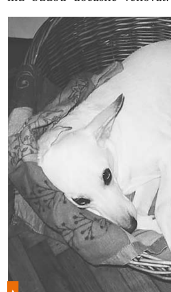
Psa samotného doma dlouho rozhodně nenechávejte

■ PAPOUŠEK – ať už doma máme drobnou andulku, nebo třeba velkého žaka, jsou-li ochočení a fixováni na člověka, samotné je nechat nemůžeme, stresem ze samoty by mohli i uhynout nebo se třeba začít oškubávat. Raději ho i s klecí umístíme k přátelům či příbuzným, kteří se mu budou dočasně věnovat.