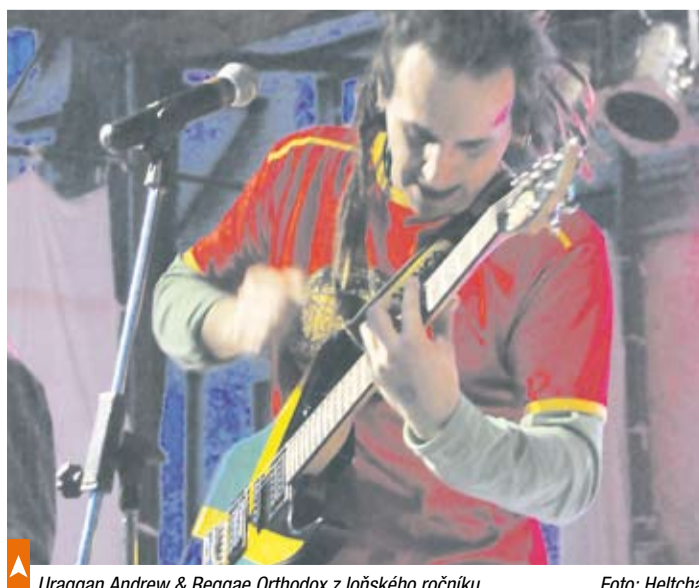
Uraggan Andrew & Reggae Orthodox z loňského ročníku