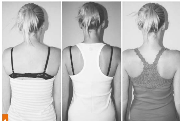
Zvolit vhodné spodní prádlo se v letním období vyplatí